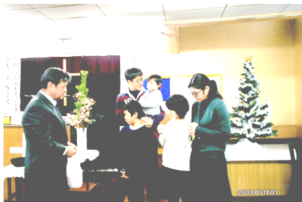
2018.1.1 1歳と10歳 二人の成長感謝祝福

「八幡浜バプテスト教会」は、現在14名ですが、長期入院者や長期入所者が4人おり、実質10人の小さな群れです。その中から、住居が遠方になったり、公立中学校教員のため日曜出勤が多くなったりして、毎週の主日礼拝が守りがたい家族が二つでき、主日礼拝出席者数が激減しています。地方の教会は、求道者をねんごろに育てて、教会員として迎え入れ、そして、送り出して行きます。その典型的なことがありました。初夏の主日に「礼拝に出さしてください」と男性医師が訪ねてきて、その日から、礼拝と祈禱会に3年間、ほとんど休むことなく出席し、祈禱会が終わった後にも、長く語り合う時を持ちました。晩夏の祈禱会の後、「バプテスマを受けたい」との申し出があり、バプテスマの準備をし、10月第4週にバプテスマを受けました。久しぶりのバプテスマ式で、教会員一同感謝して喜びました。しかし、翌週には、九州に転勤になってしまい、実質的に一週間だけの教会員増でした。毎日朝早く約6キロをジョギングし、行き交う人と声を掛け合っています。知人ができ、産物を持参して教会を訪ねて来る者もあります。「先生、僕の葬儀を教会でしてくれない。予約するよ」と言う人もいます。その人には、「分かった。教会の礼拝に出なさい」と言います。