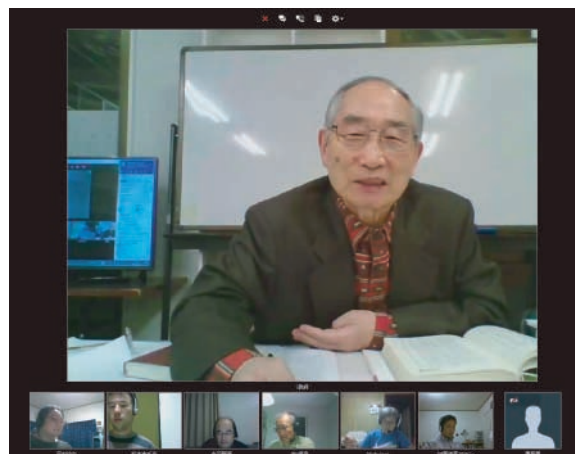
WEB カメラとパソコン、ヘッドセットマイクを使ってご自宅や出張先からリアルタイムで受講できます。

講師がパソコン、WEB カメラ、インターネットを用いて授業をテレビ中継し通信生はインターネットでリアルタイムに受講します。通信生も WEB カメラとマイクを使って授業に参加できます。